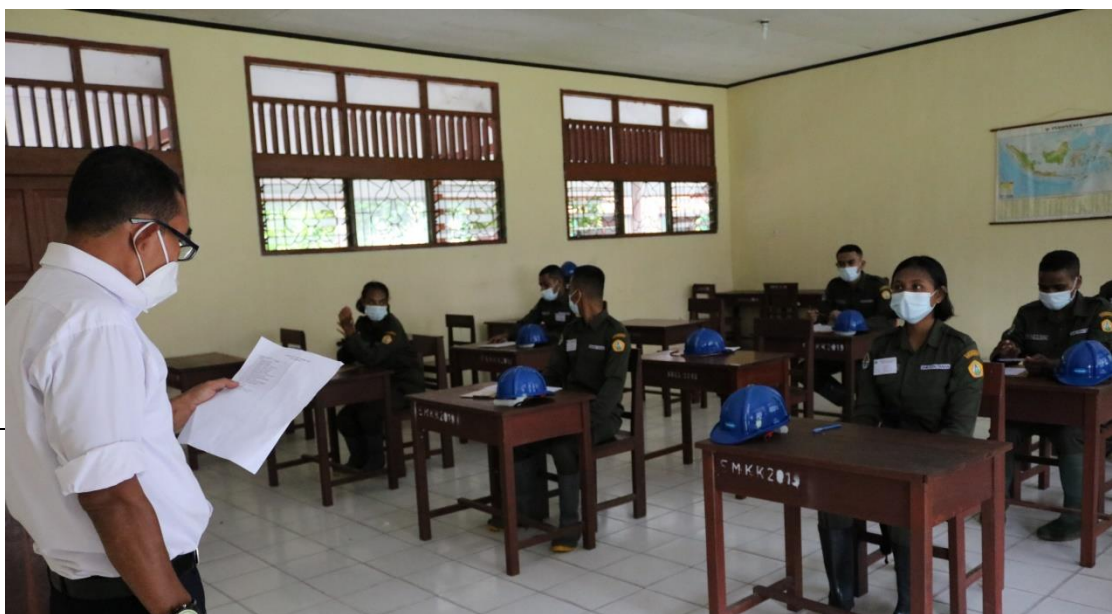
Gambar 4. Pelaksanaan UKK 2021 SMKKN Manokwari

Target dan realisasi keuangan untuk masing-masing rincian output kegiatan dapat dilihat pada Tabel 12, dan untuk capaian kinerja per kegiatan.